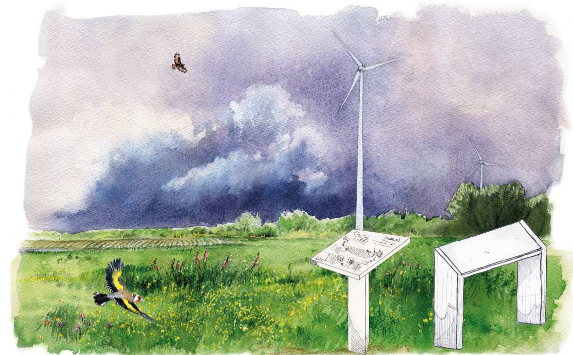
Exemple d'illustration réalisée par Jérémie EVANGELISTA (éco-interprète) dans le cadre du projet éolien de Plouisy